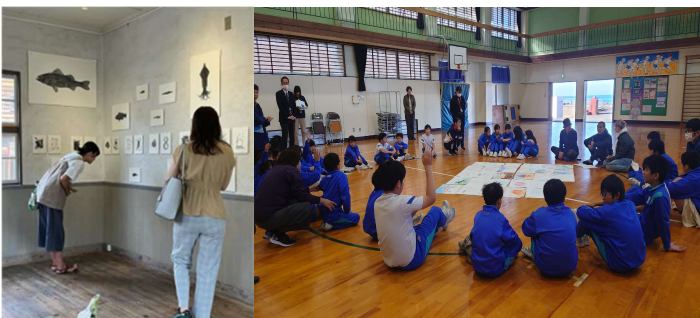
アーティスト・イン・レジデンスと学校へのアウトリーチ（福井市）