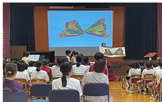
インクルーシブコンサート（若狭町）