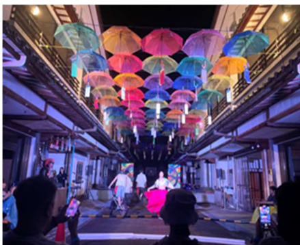
アートを活用した商店街活性化事業（勝山市）