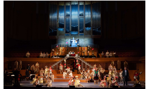
ミュージカル「雪の女王」(R4.9.19)