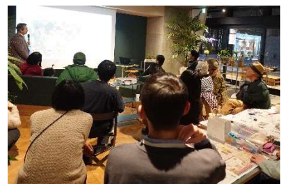
アート茶会の様子