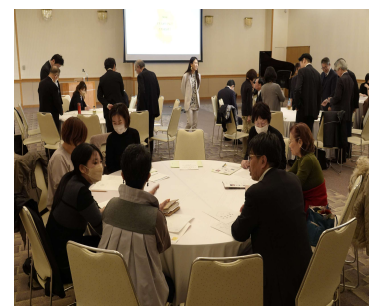
文化芸術セミナー