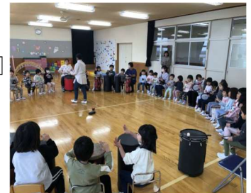
こども園でのドラムサークル